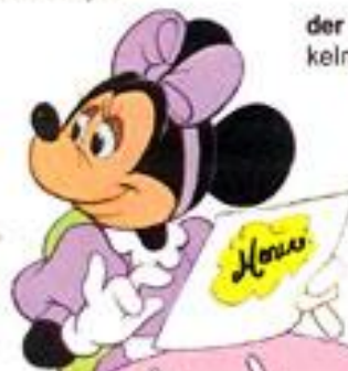
die Speisekarte jadłospis