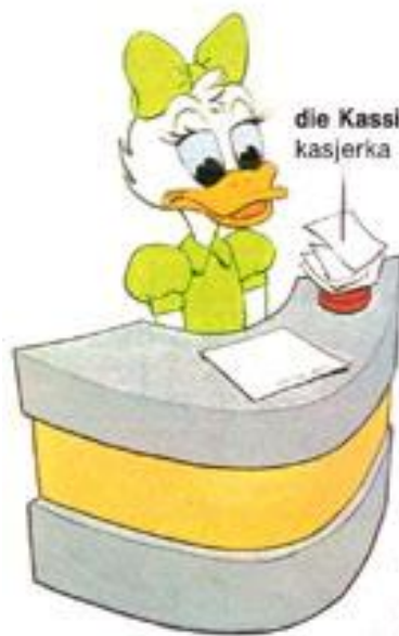
die KassiererIn kasjerka