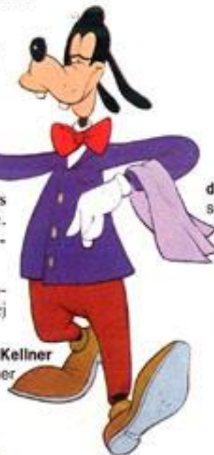
der Kellner kelner