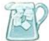
Wasser mit Eis woda z lodem

Manchmal essen wir das Mittagessen nicht zu Hause. Warst du schon im ähnlichen Restaurant?