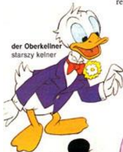
der Oberkellner starszy kelner