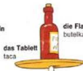
das Tablett taca